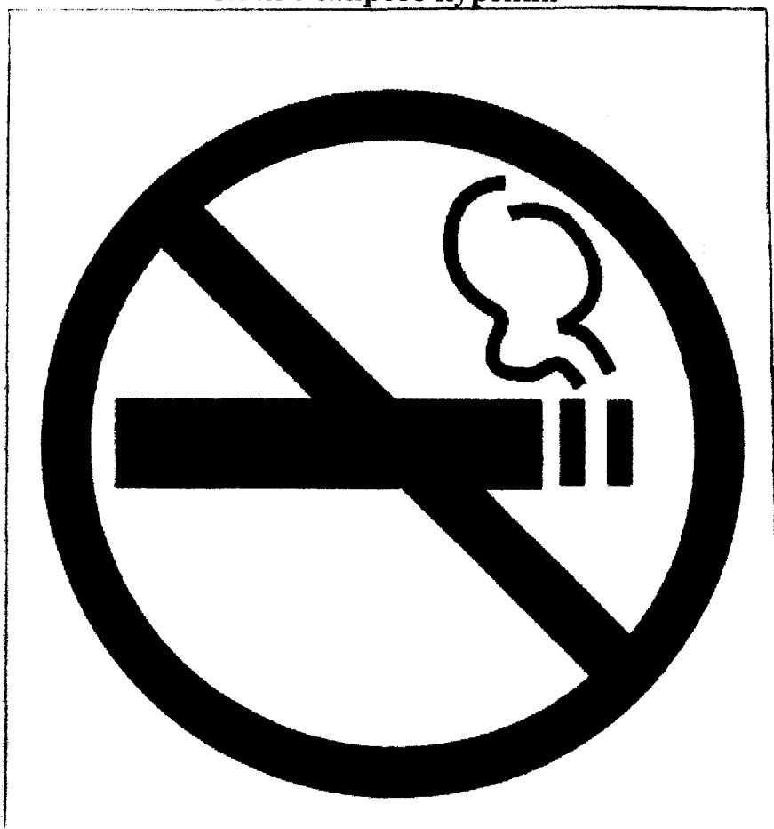
Знак о запрете курения